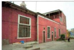
Vista fechada por Pasaje interior