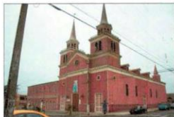
Vista fechada por Av. Almirante Latorre