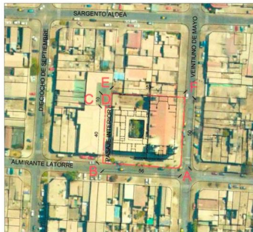
PLANO DE LÍMITES ESCALA GRÁFICA