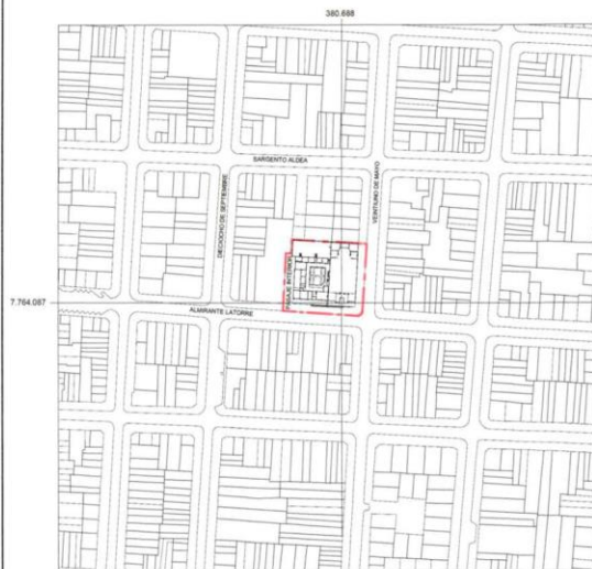
PLANO DE UBICACIÓN ESCALA GRÁFICA